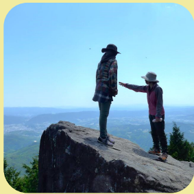
笠置山 笠置峡 など

2日目は実際に里山暮らしするのにぜひ知っておきたい!笠置町の地形や歴史、特徴をまるっと体感できる「笠置里山めぐり」を開催します。