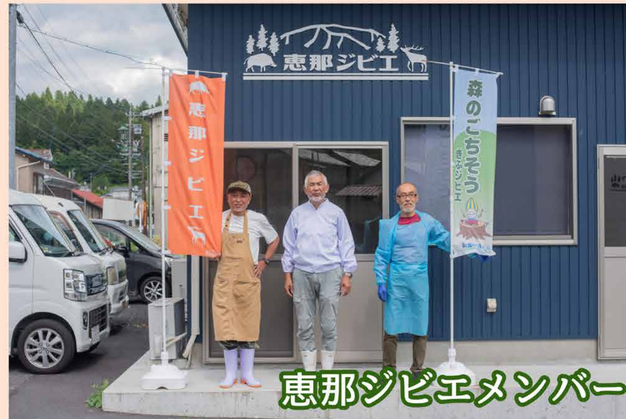
恵那ジビエメンバー