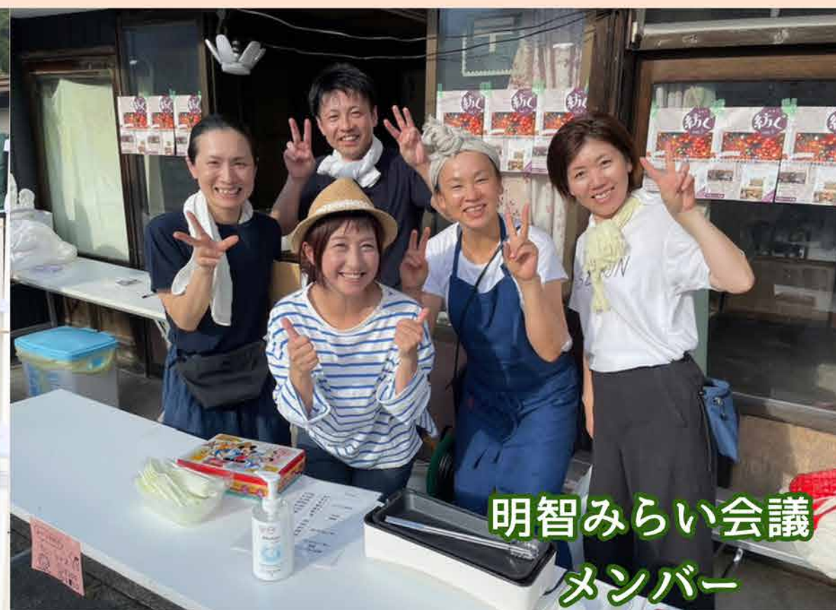
明智みらい会議 メンバー