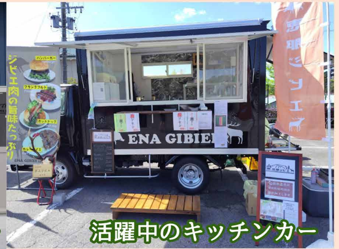
活躍中のキッチンカー